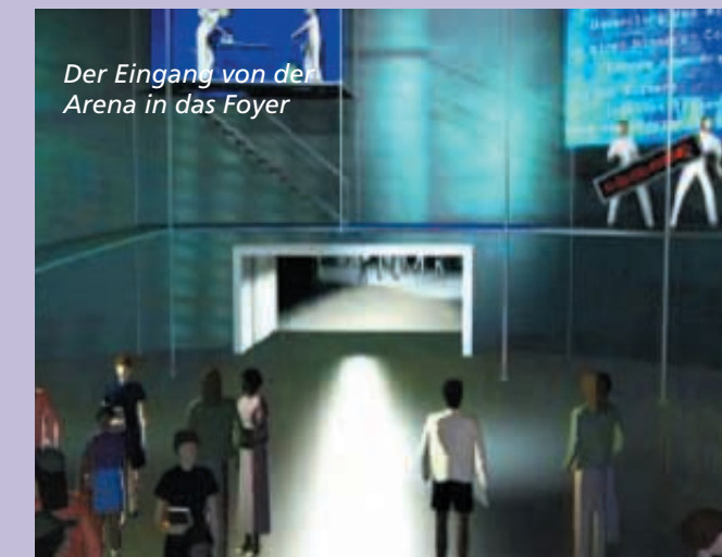
Der Eingang von der Arena in das Foyer