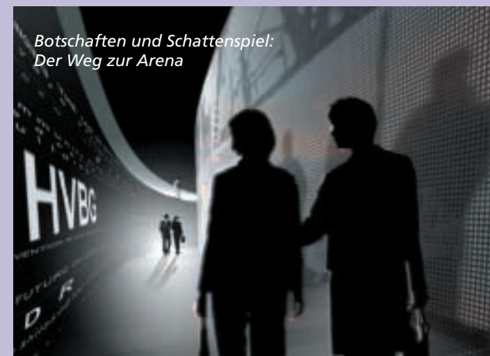
Botschaften und Schattenspiel: Der Weg zur Arena