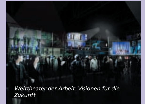
Welttheater der Arbeit: Visionen für die Zukunft