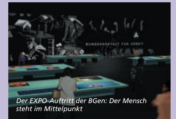
Der EXPO-Auftritt der BGen: Der Mensch steht im Mittelpunkt