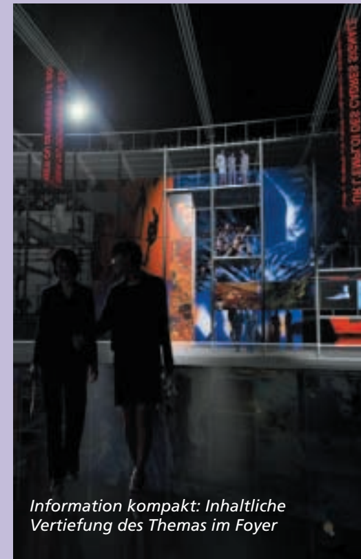
Information kompakt: Inhaltliche Vertiefung des Themas im Foyer