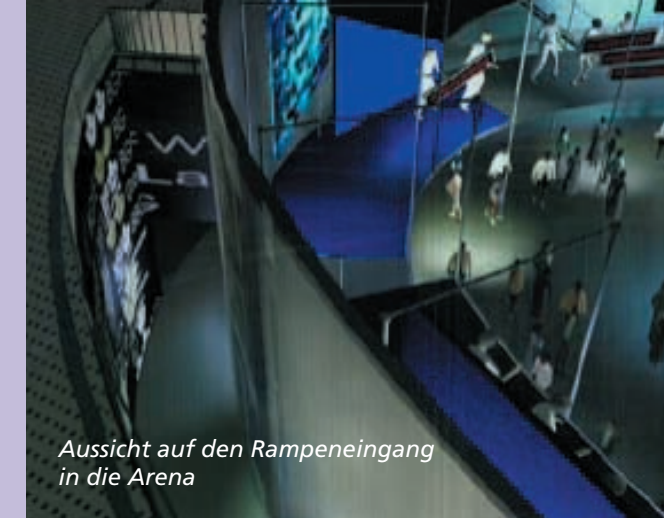
Aussicht auf den Rampeneingang in die Arena