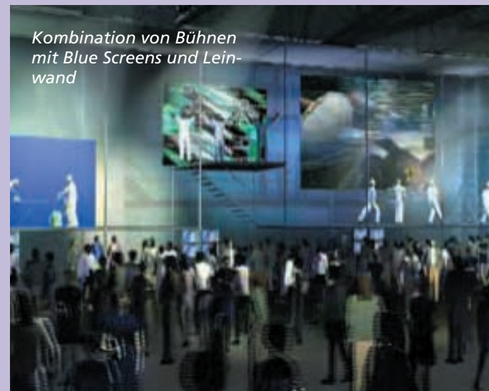
Kombination von Bühnen mit Blue Screens und Leinwand

Die Weltausstellung Expo 2000 findet in der Zeit vom 1. Juni bis 31. Oktober 2000 in Hannover statt.