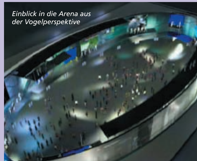
Einblick in die Arena aus der Vogelperspektive