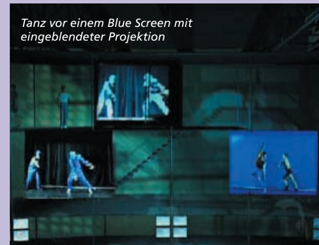
Tanz vor einem Blue Screen mit eingeblendeter Projektion