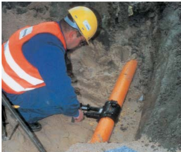
Gasfreie Druckanbohrmatur für PE-Leitungen

die Erstellung von Anschlüssen (insbesondere Hausanschlüssen), den Ein- und Ausbau von Armaturen sowie die Außerbetriebnahme von Gasleitungen auf Zeit oder auf Dauer. Müssen hierbei Gasleitungen getrennt oder angebohrt werden, kann durch die Wahl geeigneter Arbeitsverfahren eine Gasausströmung vermieden werden. Damit wird die Brand- und Explosionsgefahr erheblich reduziert. Im Folgenden werden einige Arbeitsverfahren vorgestellt, die als Alternativen für das Arbeiten unter kontrollierter Gasausströmung bzw. das Setzen der Absperrblasen von Hand in Frage kommen